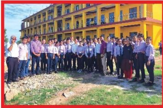
प्रदेश सरकारद्वारा निर्मित पञ्चोदय क्याम्पस दाङको भवन