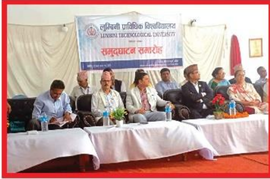
लुम्बिनी प्रविधिक विश्वविद्यालयको उदघाटन समारोह