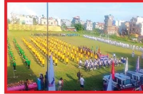
नवौँ राष्ट्रिय खेलकुद छनोट तयारी २०७९ असोज १ गते