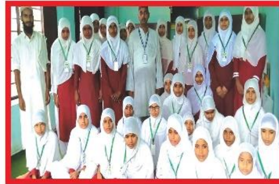
मदरसा मदिनातुल उलुम प्रतापपुर पश्चिम नवलपरासीमा अध्ययनरत छात्राहरु