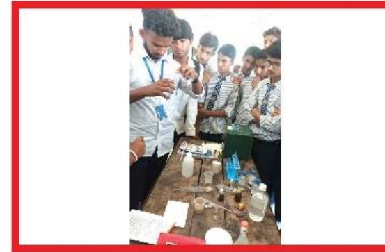
STEM शिक्षा अन्तर्गत विद्यार्थीहरु निर्मित सामग्री प्रदर्शन