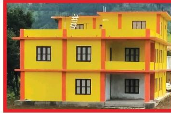
नवनेपाल क्याम्पस जुझार रोल्पाको चार कोठे भवन